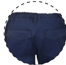
PRETINA ELASTICADA EN TRASERO